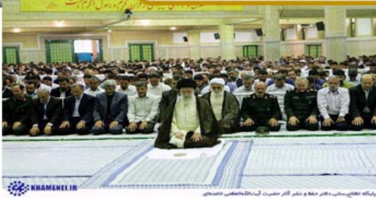
رئیس هیئت مدیره و مدیر امور حضرت آیت‌الله العظمی صاحبزاده