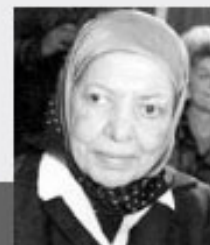
دکتر عایشه بنت الشاطی